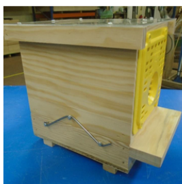
piège nasse à grilles Néoppi jaunes