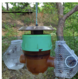
piège coréen à ailes